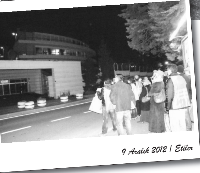
9 Aralık 2012 | Etiler

İşten atılan, ücret ve tazminat haklarını alamayan Hey Tekstil işçileri direnişlerini yaptıkları eylemlerle sürdürüyorlar. İşçiler hafta içi her gün TOBB binasına önünde, Cumartesi günü diğer direnişlerle ortak olarak Taksim'de yürüyüş yapıyor. Polisin baskılarına ve saldırılarına rağmen direnişlerini kararlılıkla sürdüren işçiler, bu hafta ayrıca patrona ve oğluna ait evin bulunduğu site önünde eylem gerçekleştirdiler.