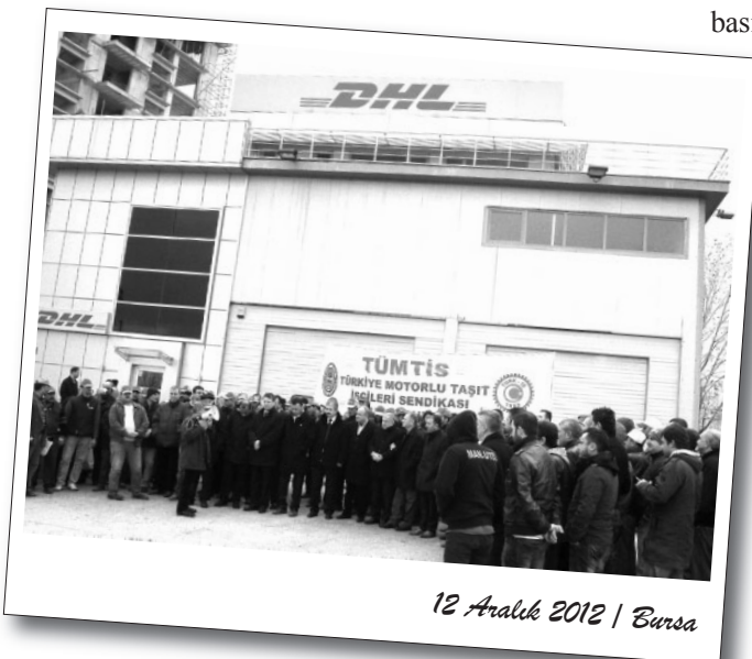
12 Aralık 2012 | Bursa