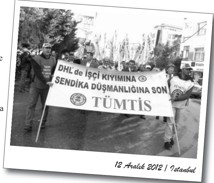
12 Aralık 2012 | İstanbul

"Bu mücadele artık, sadece Türkiye'deki DHL işçilerinin ve sendikamızın mücadelesi olmaktan çıkmış ve ITF'e bağlı 154 ülkeden yüzlerce sendikamızın mücadelesine dönüşmüştür. Artık dünyadaki bütün taşımacılık işçilerinin ve emekçilerinin mücadelesi haline gelmiştir. Birçok ülkede alanlara çıkan işçiler, DHL işçilerinin yaşadıklarının sadece Türkiye işçilerinin sorunu olmadığını bilincindedir. Emekçilerin talepleri